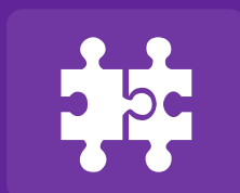
Farben in CxF-Bibliotheken suchen