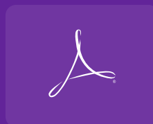
CxF-Daten in PDF-Dateien verwalten