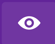
Überwachte Ordner konfigurieren und kontrollieren