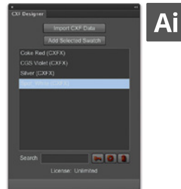
ORIS CxF Designer